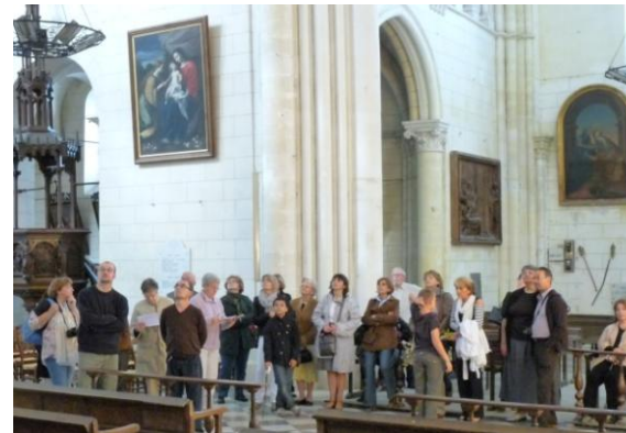
Visites de la Collégiale (août et journées du Patrimoine)