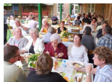
Fête dans le quartier du Chapitre samedi 31 juillet 2010