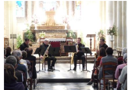
Concert dimanche 25 juillet 2010 par le Quatuor de Saxophones d'Hirson